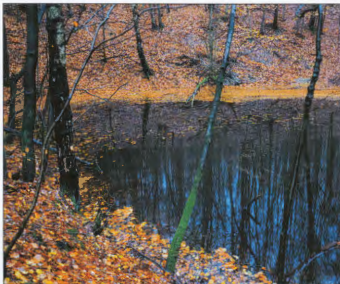
Der "Schwarze Pfuhl", ein ehemaliger Bergbauschacht

Treffpunkt: Marktplatz Altenbeken, Fahrt nach Himmighausen Bahnhof