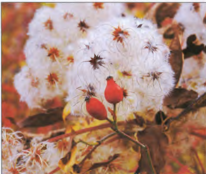
Am Hagebuttenweg am Osthang der Egge