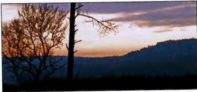
Der Rehberg von Osten