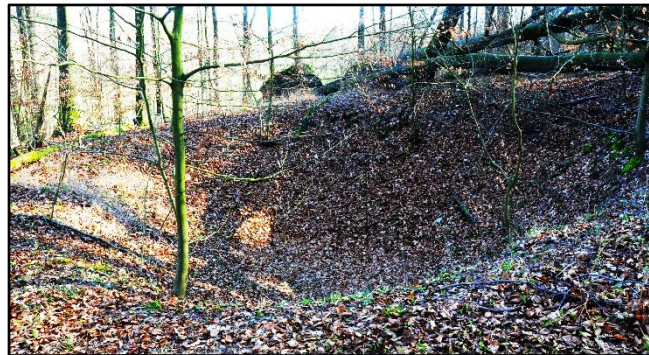
Bombentrichter am Kobbenacken