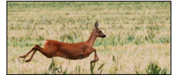
Reh auf der Flucht