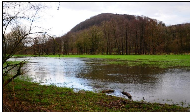
Überschwemmte Wiesen im Beketal, Januar 2024