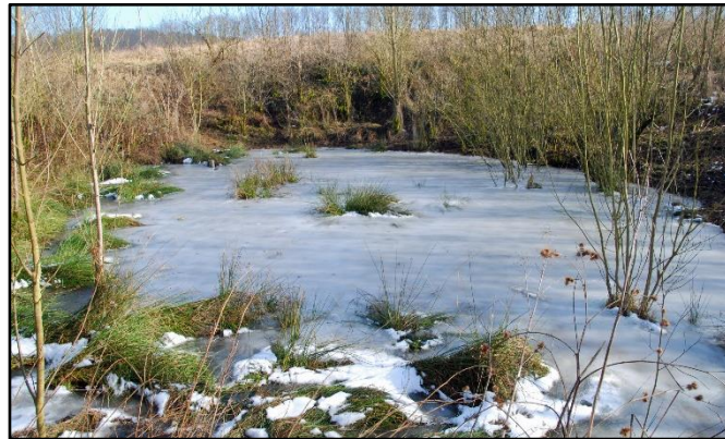
Weringer Pohl, eine Nassdoline

Die Exkursion führt uns vom Waldhaus Durbeke auf den Kobbenacken bei der Burenlinde. Über den historischen Stadtweg gelangen wir zur Großen Brichkuhle und zum Weringer Pohl, eine Nassdoline. Vorbei an Hindahls Kreuz führt der Weg in das Beketal. Am Standort eines ehemaligen Beke-Stauwehres erkennen wir frühere Flößgräben, die der Bewässerung der Talwiesen dienten, bevor wir zurück zum Waldhaus gehen. Weglänge ca. 8,0 km Treffpunkt: Am Waldhaus in der Durbeke bei der ehemaligen Oberförsterei.