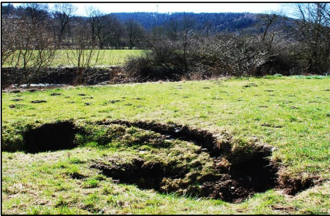
Erdfall an der Beke (zur Herbstexkursion).

Die Exkursions- und Vortragstermine sowie eventuelle Änderungen werden rechtzeitig in der Presse bekannt gegeben. Festes Schuhwerk und der Witterung angemessene Kleidung werden empfohlen. Die Teilnahme an allen Veranstaltungen geschieht auf eigene Gefahr. Der Verein übernimmt keine Haftung für die Teilnehmer.