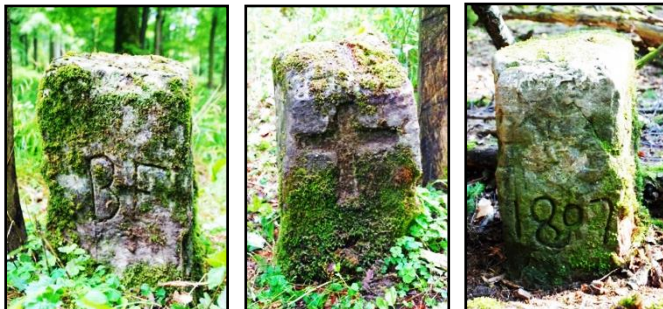
Grenzstein Nr.1 aus 1807 zw. Bistum PB und Bembüren