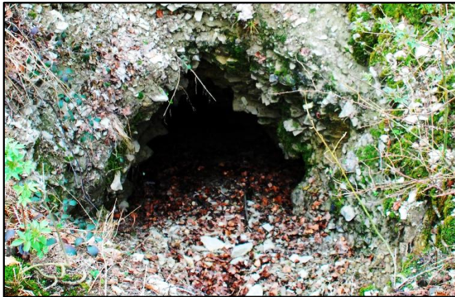
Hirschhöhle, ein Erdfall im Muschelkalk

Der Rundweg beginnt am Parkplatz im Driburger Grund. Auf dem Weg bis zur Knochenhütte entdecken wir ehemalige Erzabbaustätten und Glashütten. Durch den Schnadegrund und die östlich des Eggekammes liegenden Ziegentalgründe gelangen wir zur Hirschhöhle (Erdfall) und zu einem nahe liegenden ehemaligen Kalkofen. Vorbei an Pinggen und Halden erreichen wir den Scholandstein. Über den Eisensteinweg kommen wir zurück in den Driburger Grund. Weglänge ca. 7,5 km Treffpunkt: Freizeitanlage im Driburger Grund